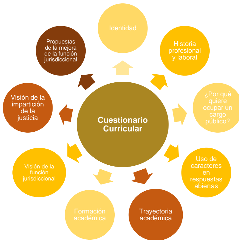
Gráfica 2. Dimensiones a evaluar