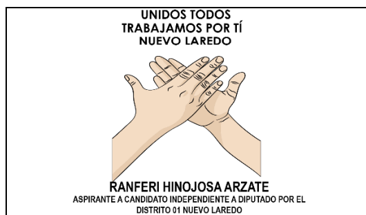
Emblema contenido en el USB o Disco Compacto

En cuanto al análisis del emblema que se adjunta a la manifestación de intención, se advierte que cumple con lo establecido en el considerado XXVII, así como al Anexo 3 de la Convocatoria ( Emblemas y colores de los partidos políticos nacionales con acreditación en el Instituto Electoral de Tamaulipas ).