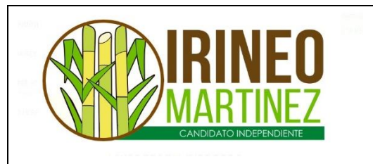
Emblema contenido en el USB o Disco Compacto

En cuanto al análisis del emblema que se adjunta a la manifestación de intención, se advierte que cumple con lo establecido en el considerado XXVII, así como al Anexo 3 de la Convocatoria ( Emblemas y colores de los partidos políticos nacionales con acreditación en el Instituto Electoral de Tamaulipas ).