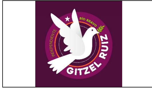
Emblema contenido en el USB o Disco Compacto

En cuanto al análisis del emblema que se adjunta a la manifestación de intención, se advierte que cumple con lo establecido en el considerado XXVII, así como al Anexo 3 de la Convocatoria ( Emblemas y colores de los partidos políticos nacionales con acreditación en el Instituto Electoral de Tamaulipas ).