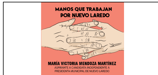
Emblema contenido en el USB o Disco Compacto

En cuanto al análisis del emblema que se adjunta a la manifestación de intención, se advierte que cumple con lo establecido en el considerado XXVII, así como al Anexo 3 de la Convocatoria ( Emblemas y colores de los partidos políticos nacionales con acreditación en el Instituto Electoral de Tamaulipas ).