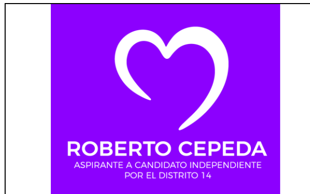
Emblema contenido en el USB o Disco Compacto

En cuanto al análisis del emblema que se adjunta a la manifestación de intención, se advierte que cumple con lo establecido en el considerado XXVII, así como al Anexo 3 de la Convocatoria ( Emblemas y colores de los partidos políticos nacionales con acreditación en el Instituto Electoral de Tamaulipas ).