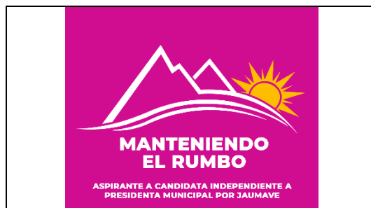
Emblema contenido en el USB o Disco Compacto