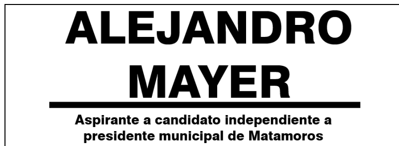
Emblema contenido en el USB o Disco Compacto