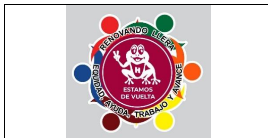
Emblema contenido en el USB o Disco Compacto

En cuanto al análisis del emblema que se adjunta a la manifestación de intención, se advierte que cumple con lo establecido en el considerado XXVII del presente Acuerdo, así como al Anexo 3 de la Convocatoria ( Emblemas y colores de los partidos políticos nacionales con acreditación en el Instituto Electoral de Tamaulipas ).