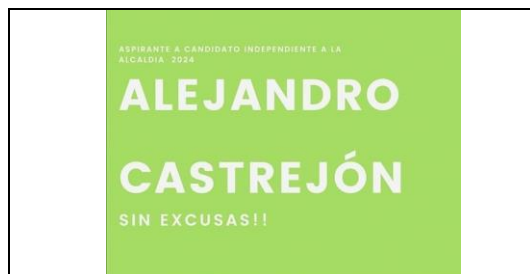
Emblema contenido en el USB o Disco Compacto

En cuanto al análisis del emblema que se adjunta a la manifestación de intención, se advierte que cumple con lo establecido en el considerado XXVII del presente Acuerdo, así como al Anexo 3 de la Convocatoria (Emblemas y colores de los partidos políticos nacionales con acreditación en el Instituto Electoral de Tamaulipas).