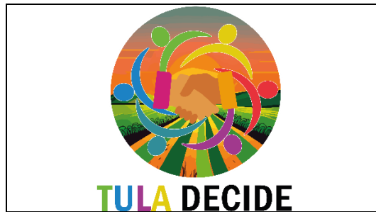
Emblema contenido en el USB o Disco Compacto

En cuanto al análisis del emblema que se adjunta a la manifestación de intención, se advierte que cumple con lo establecido en el considerado XXVII, así como al Anexo 3 de la Convocatoria ( Emblemas y colores de los partidos políticos nacionales con acreditación en el Instituto Electoral de Tamaulipas ).