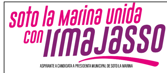
Emblema contenido en el USB o Disco Compacto

En cuanto al análisis del emblema que se adjunta a la manifestación de intención, se advierte que cumple con lo establecido en el considerado XXVII, así como al Anexo 3 de la Convocatoria ( Emblemas y colores de los partidos políticos nacionales con acreditación en el Instituto Electoral de Tamaulipas ).