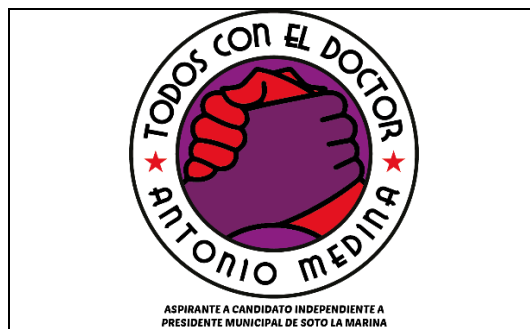
Emblema contenido en el USB o Disco Compacto

En cuanto al análisis del emblema que se adjunta a la manifestación de intención, se advierte que cumple con lo establecido en el considerado XXVII, así como al Anexo 3 de la Convocatoria ( Emblemas y colores de los partidos políticos nacionales con acreditación en el Instituto Electoral de Tamaulipas ).