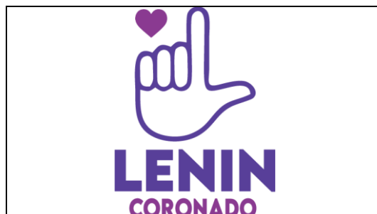
Emblema contenido en el USB o Disco Compacto