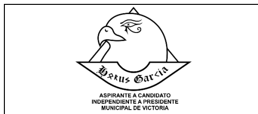
Emblema contenido en el USB o Disco Compacto

En cuanto al análisis del emblema que se adjunta a la manifestación de intención, se advierte que cumple con lo establecido en el considerado XXVII, así como al Anexo 3 de la Convocatoria (Emblemas y colores de los partidos políticos nacionales con acreditación en el Instituto Electoral de Tamaulipas).