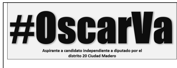
Emblema contenido en el USB o Disco Compacto

En cuanto al análisis del emblema que se adjunta a la manifestación de intención, se advierte que cumple con lo establecido en el considerado XXVII, así como al Anexo 3 de la Convocatoria ( Emblemas y colores de los partidos políticos nacionales con acreditación en el Instituto Electoral de Tamaulipas ).