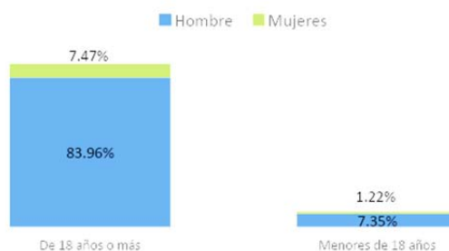
Repatriación de mexicanos desde estados unidos según grupos de edad y sexo, 2020

En el periodo comprendido de enero a septiembre del año 2021 la Unidad de Política Migratoria, Registro e Identidad de Personas reporta, un total de 19,962 10 eventos de repatriación por el Estado. En vista de esto y la condición de espacio geográfico con fácil acceso a Estados Unidos supone retos importantes para el Estado.