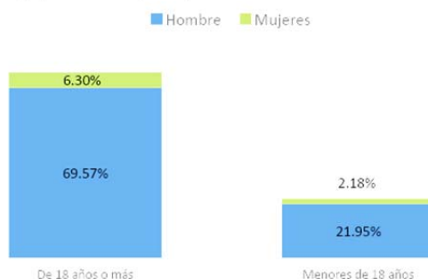
Repatriación de mexicanos desde estados unidos según grupos de edad y sexo, 2021

En el periodo comprendido de enero a septiembre del año 2021 la Unidad de Política Migratoria, Registro e Identidad de Personas reporta, un total de 19,962 10 eventos de repatriación por el Estado. En vista de esto y la condición de espacio geográfico con fácil acceso a Estados Unidos supone retos importantes para el Estado.