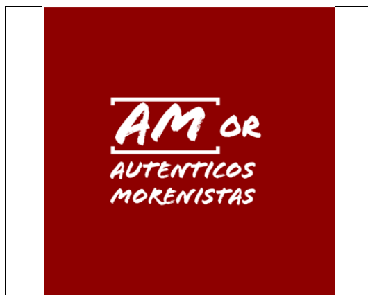
Emblema contenido en el USB o Disco Compacto