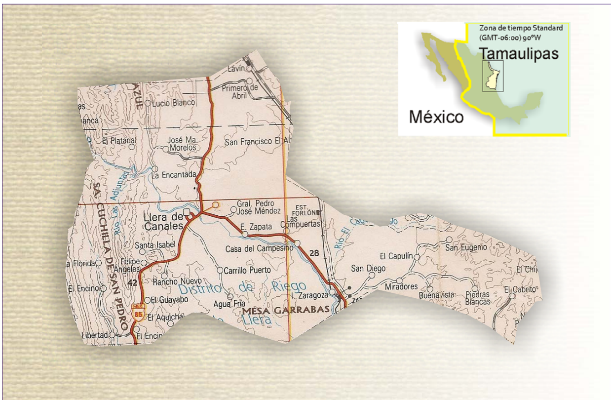
Figura 2.1 Mapa municipal

Flora y fauna: el territorio por su diferencia de niveles y variaciones en el clima presenta una gran diversidad de tipos de vegetación, que van desde matorral alto espinoso en las estribaciones de la sierra, hasta el matorral más bajo y selva baja caducifolia espinosa en la porción central. La fauna se compone de conejo, liebre, armadillo, jabalí, gato montés, guajolote silvestre y tejón, además de venado cola blanca, oso negro, jaguar y puma.