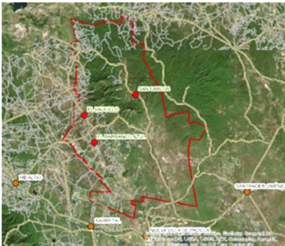
Mayor a 500 habitantes

Por otra parte la dispersión de las localidades es notable como se puede apreciar en las siguientes imágenes: